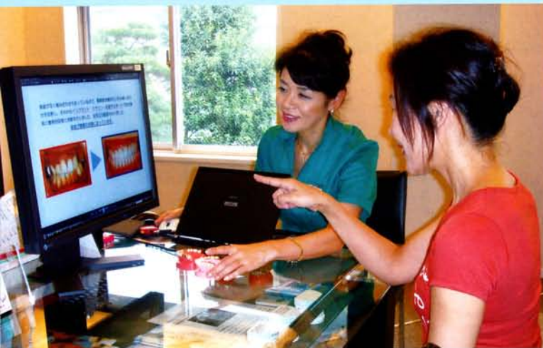
広く、落ち着いた雰囲気のカウンセリングルームで行われるカウンセリング