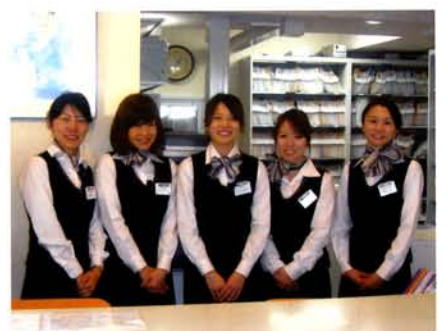
受付業務にも専属のスタッフを配置。全員がおもてなしの心で患者に接している

制を採り、急患などで患者を30分以上待たせてしまった場合に、丁寧に謝罪して心づくしの品を渡す、子ども連れの患者のために託児サービスを提供するなど、細部にまで気を配る。こうした意識は30名にもおよぶスタッフにも浸透しており、患者のために最高のチーム医療を目指して、全員が技術の向上に努めている。