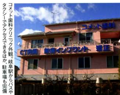
コメット歯科クリニック外観。岐阜駅からバスやタクシーでアクセスできるほか、駐車場も完備

診療科目: 歯科、歯科口腔外科、矯正歯科、小児歯科 診療時間: 月・土 9:00~13:00/14:00~18:30 火・水・金 9:00~13:00/14:00~17:30 ※完全予約制、急患は随時受付 休診日: 木・日・祝 〒502-0843 岐阜県岐阜市早田東町7-14 TEL.058-233-6262(代表) http://comet-1.com/