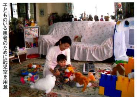
子どものいる患者のために託児室を用意